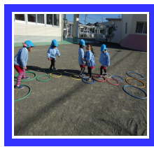
ケンケンパーが上手になったよ