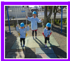
ブランコで仲良く

引き続き感染予防のため、手洗い・うがいをしっかり行いましょう。体調には十分注意し、早目の休養を心がけて下さい。「2月は逃げる」と言われるように、あっという間に過ぎていきそうなので、一日一日を大切に過ごしていきたいです。