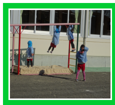
うんていに挑戦中