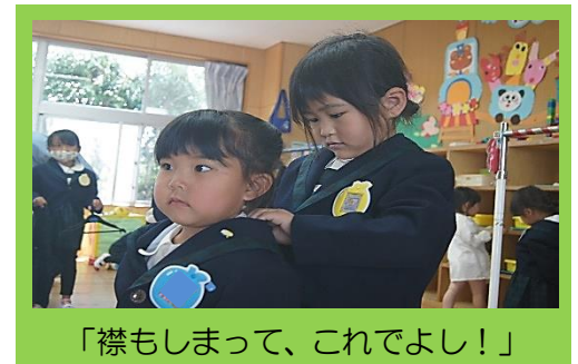
「襟もしまって、これでよし！」