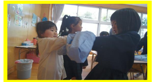
「まずは遊び着を脱ごうね！」

年少ゆり組の着替えが始まり、着替えの手伝いをしています。遊び着を脱がすことに苦戦したり、走り回る子がいたり、思うようにいかないこともあります。最後まで手伝ってあげる姿がさすが年長児だなと感じました。着替え終わるとパペット人形で話掛けてあげたり、アンパンマンの手遊びをしていたりと自分から関わりを持ち、すみれっこの頼れるお兄さん、お姉さんになりつつあります。これからも一緒に遊び、フレンド（異年齢活動）での関わりも多く持っていく予定です。